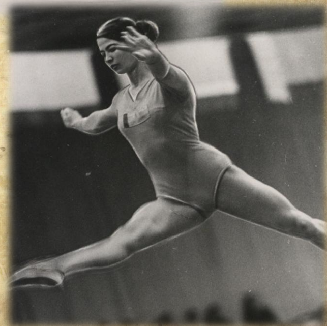
Чемпионка мира по спортивной гимнастике Л. Турищева. 1968 год.