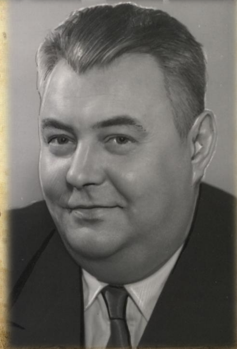
Писатель - драматург А.В. Софронов. 1969 год.