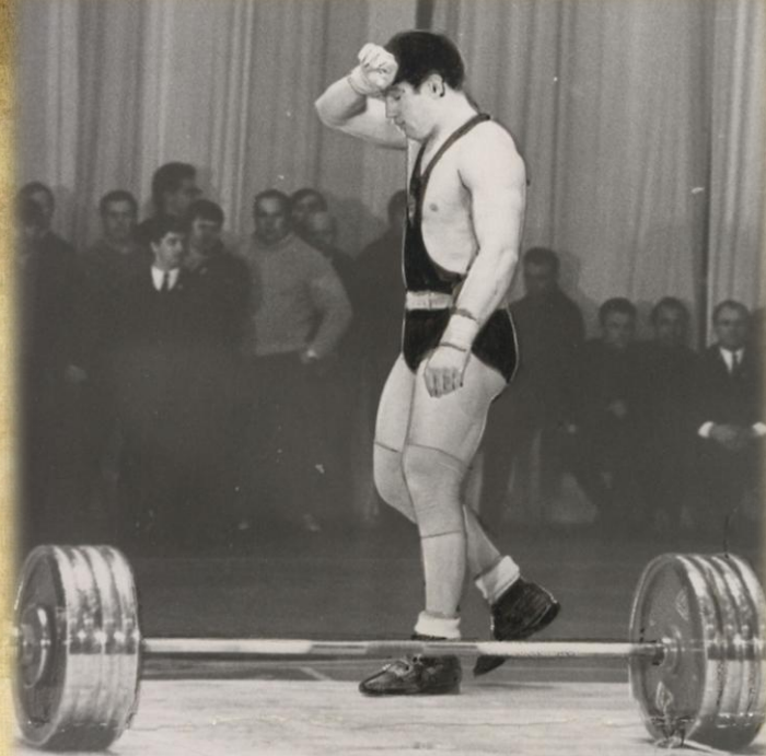
Чемпион мира по тяжёлой атлетике Давид Ригерт. 1968 год.