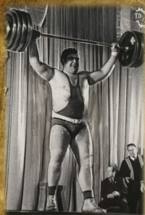
Новый мировой рекорд В.И.Алексеева. 1970 год.