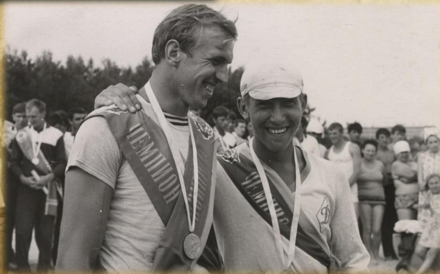
Чемпионы СССР в академической гребле А.Зацаринный и В.Гормаш. 1969 год.