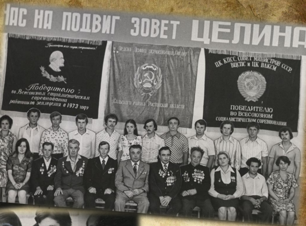
Победители социалистического соревнования, посвящённого 25-летию освоения целины, с ветеранами производства и первоцелинниками. Июнь 1979 года.